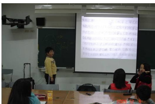
科學展覽作品報告、分享及討論