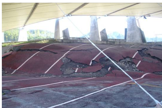
科學教育參訪活動