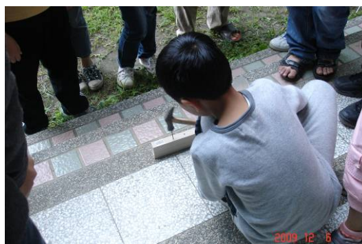
科學應用活動教學