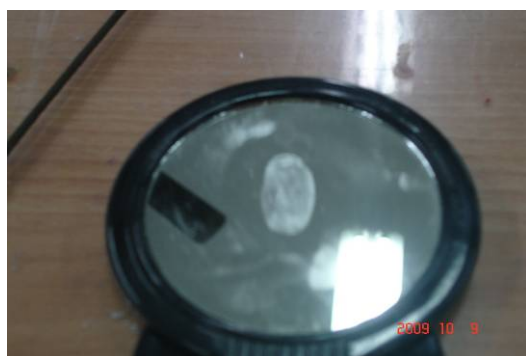
科學展覽探究活動