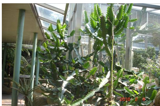
科學教育參訪活動