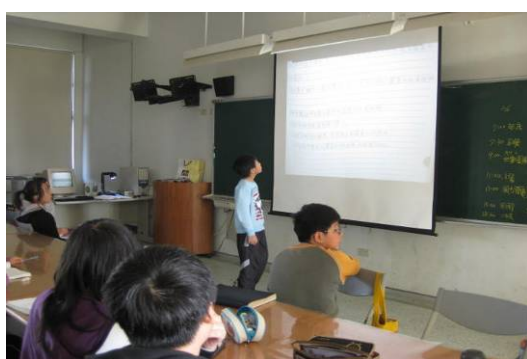
科學展覽作品報告、分享及討論