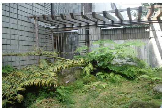
科學教育參訪活動