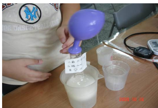
科學展覽探究活動