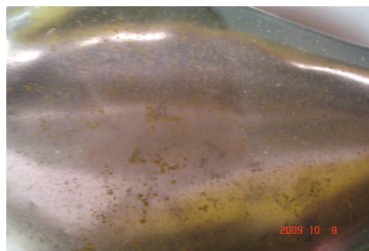
科學展覽探究活動