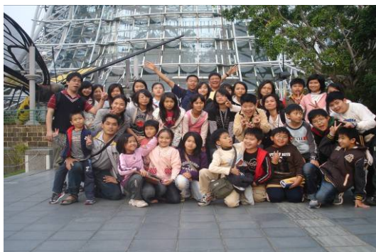
科學教育參訪活動