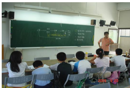
論證教學活動的進行